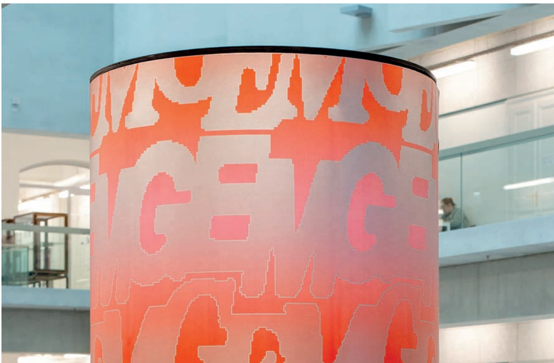
Gem Gem

Béla Meiers ist Grafikdesigner mit Schwerpunkt auf visuellen Identitäten, Editorial- und Webdesign. Neben kollaborativen Projekten mit Künstler*innen arbeitet Béla für Institutionen in den Bereichen Kultur, Wissenschaft und politische Bildung.