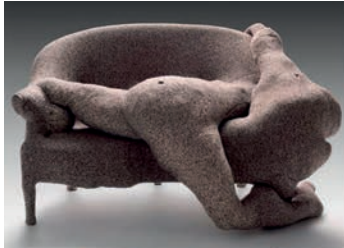
Dorothea Tanning, Rainy Day Canapé, 1970 © The Philadelphia Museum of Art

Regelmäßige Teilnahme und Vorstellung/Abgabe eines kleinen Recherchebeitrages zum Textilen in der Kunst. Dieser Beitrag kann auch eine eigene künstlerischen Arbeit und deren Kontext einbeziehen.