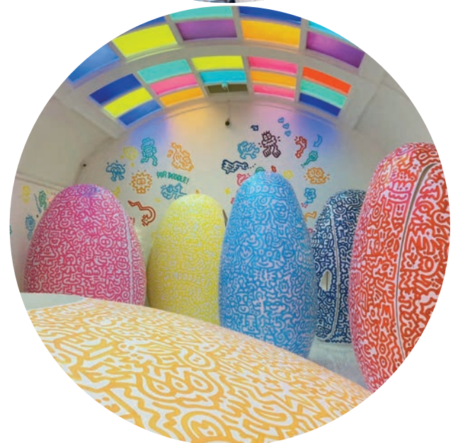
Bild oben: Comme des Garçons S/S 2001, S/S 2011 Bild unten: Mr Doodle, Restaurant Sketch, London 2024

• im BA Studium anrechenbar für FOR: Technologien/Praxen (dex/tex) (2 ECTS)