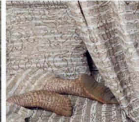
Lalla Essaydi, Les Femmes du Maroc, 2008