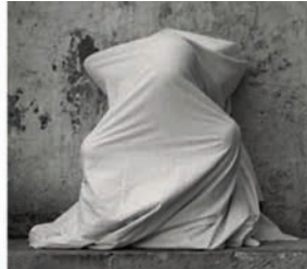
Ana Mendieta, Untitled (Cuilapán Niche) 1973