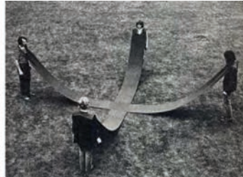
Franz Erhard Walther, Kreuzverbindungen, 1967 © Portfolio Franz Erhard Walther, Galerie Wolff