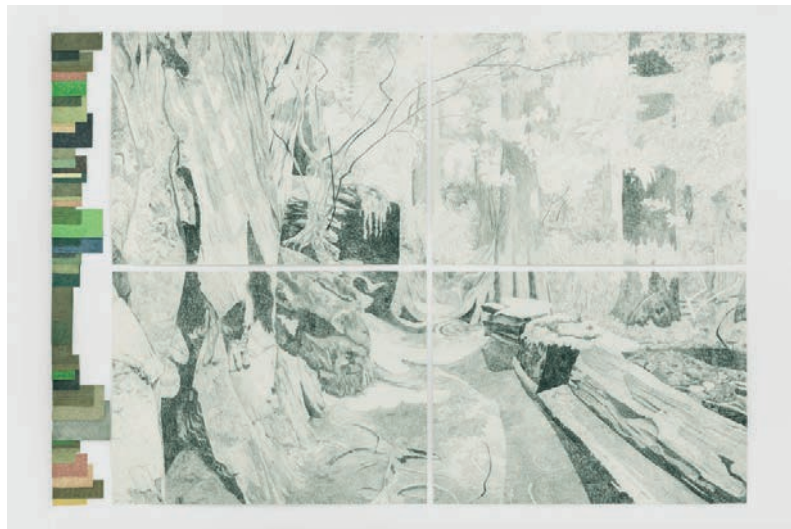
Gabriela Albergaria, Landscape in Repair #1, 2019.